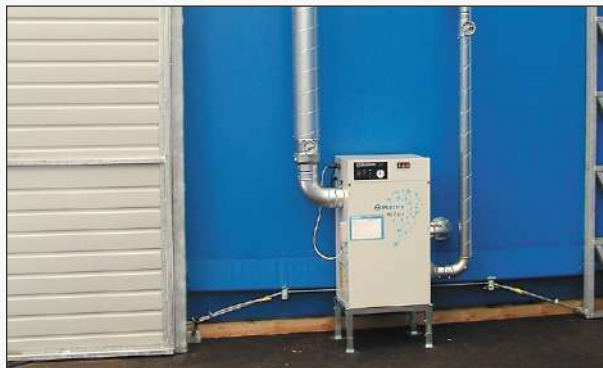
PMH Torrluftlager är som standard utrustad med avfuktare.